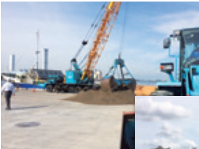
青森から船で運搬された海砂。中京競馬場へ運ばれます。

厳寒期になると砂自体が凍ってしまうため、開催時には必要に応じて不凍剤を散布して備えます。