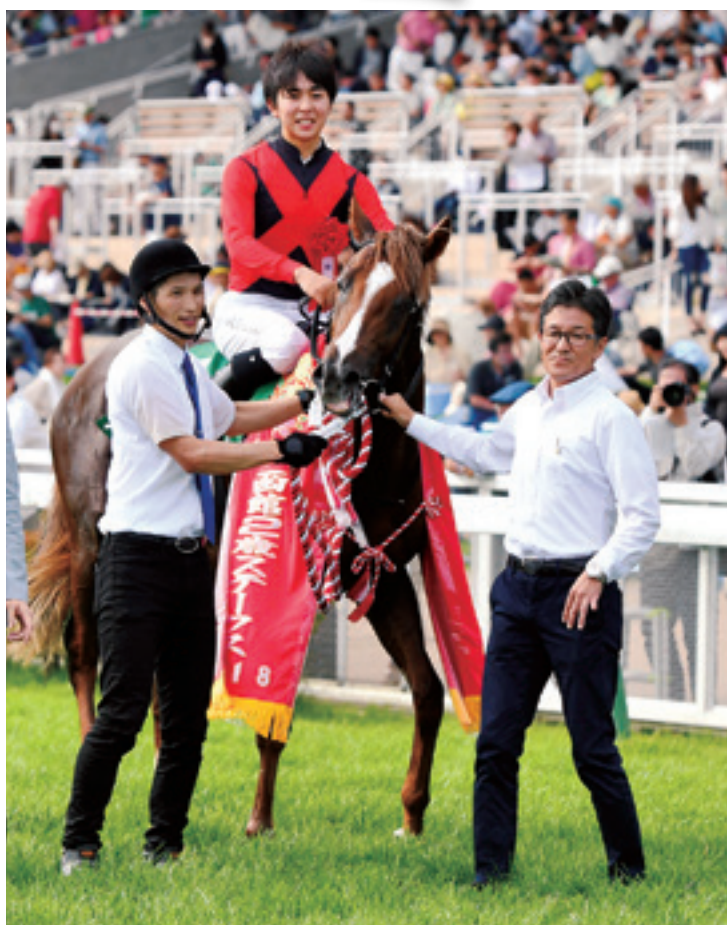
2018年7月「函館2歳ステークス(GIII)」で優勝したアスターペガサス。