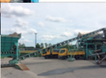
砂を洗浄するプラント。ホコリの原因となる細かい粒子を取り除きます。