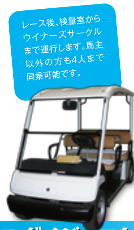
レース後、検量室からウイナースサークルまで運行します。馬主以外の方も4人まで同乗可能です。