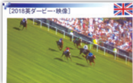
スライドや動画を用いて分かりやすく解説いただきました。