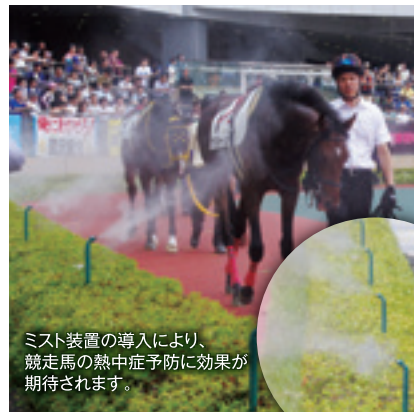
ミスト装置の導入により、競走馬の熱中症予防に効果が期待されます。

暑さ対策の二環として、パドックにミスト装置が設置されました。馬も心なしか涼しげな様子を見せていました。